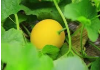
キンショウメロン