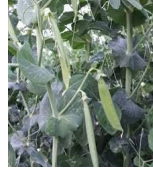
スナップエンドー